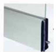
παλινή τάπα με inox σύρτη