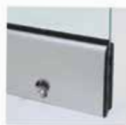
Μηχανισμός κλειδώματος με μισό κύλινδρο και πόμολο