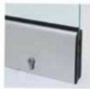
Μηχανισμός κλειδώματος με κύλινδρο