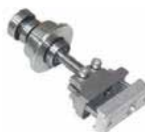
Ράουλο με σφαιγκτήρα inox