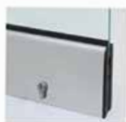
Μηχανισμός κλειδώματος με κύλινδρο