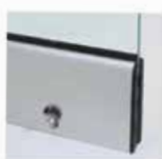
Μηχανισμός κλειδώματος με μισό κύλινδρο και πόμολο