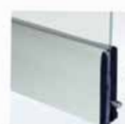
παλινή τάπα με inox σύρτη