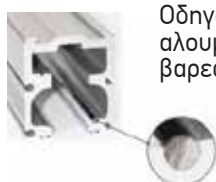
Οδηγός αλουμινίου βαρετώ τύπου